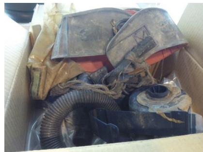
Imágenes de Equipos Motorizados 3M™ sin mantenimiento adecuado.